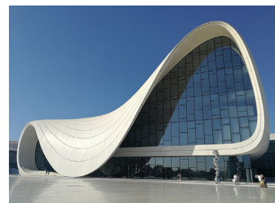
Le centre culturel Heydar-Aliyev à Bakou