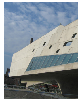
Le musée Phaeno à Wolfsburg

La maison portuaire d'Anvers a été inaugurée en septembre 2016 en l'absence de Zaha Hadid, décédée brutalement quelques mois plus tôt. Après 4 ans de travaux, ce bâtiment fait dialoguer des styles architecturaux diamétralement opposés. Prenant appui sur une caserne désaffectée de pompiers datée de la fin du XIXe siècle, une monumentale extension domine aujourd'hui le port. Plus de 2000 triangles de verre recouvre cette surélévation aux allures de vaisseau spatial futuriste. Créant un lien entre le passé et l'avenir, ce projet symbolise les deux activités économiques principales d'Anvers : sa forme en proue de navire évoque l'activité maritime tandis que ses facettes miroitantes font écho aux diamants qui ont fait la fortune de la ville. En guise d'ascenseur, une colonne de verre offre une vue panoramique sur Anvers.