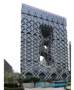
L'Hôtel Morpheus à Macao