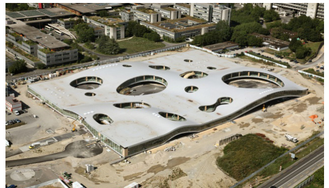
Le Rolex Learning Center d'Éculens

Le bâtiment est caractérisé par le mouvement de vagues de sa toiture en béton et par sa volumétrie à la fois basse et très étendue. Le Rolex Learning Center semble lui-même faire paysage en répondant aux vallonnements de son environnement. L'intérieur est rythmé par des pentes douces qui définissent des ambiances diverses, et génèrent des espaces intimes ou alors vastes et fédérateurs. Toutes les façades du bâtiment sont continues, entièrement vitrées et suivent l'ondulation de la toiture. Conçu sur une base rectangulaire et sur un seul niveau, l'édifice est percé par 14 patios de tailles et formes différentes.