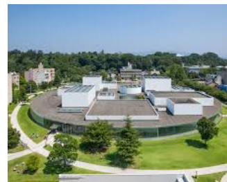
Musée d'art contemporain du XXIe siècle, Kanazawa, Japon