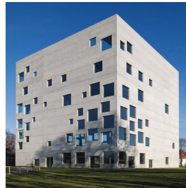
École de management et design, Zollverein, Essen, Allemagne

Directrice de son propre cabinet d'architecture, elle fonde aussi en 1995 la très célèbre agence SANAA avec un ancien employé, Ryue Nishizawa. En 2010, elle remporte le prix Pritzker aux côtés de son associé et est nommée directrice de la biennale d'architecture de Venise. L'agence SANAA a pour objectif de trouver l'adéquation parfaite entre la forme et le programme, pour cela, elle réalise de nombreuses maquettes d'étude afin de perfectionner les volumes et leurs interactions.