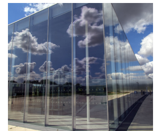
Musée du Louvre, Lens, France