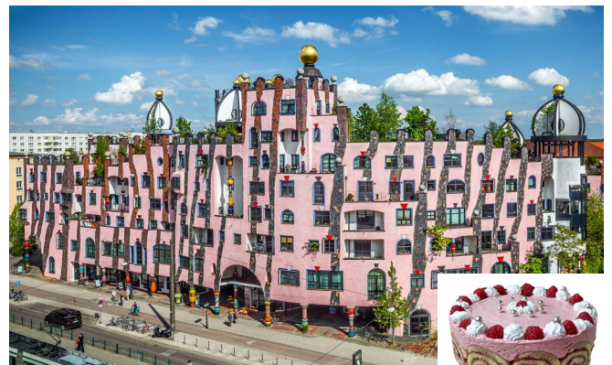
La Citadelle Verte - Friedensreich HUNDERTWASSER

Ce bâtiment est fidèle au style d'Hundertwasser, avec des murs ondulés, des angles arrondis et des fenêtres aux formes et aux tailles toutes différentes ! La végétation est présente dans tout l'immeuble et certains locataires cohabitent avec un arbre planté dans leur séjour.