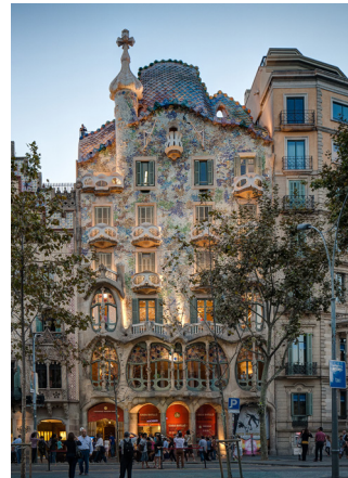
La Casa Batlló - Antonio GAUDI

Elle est construite entre 1904 et 1906, à Barcelone, en Espagne. On la reconnaît surtout à sa façade, composée de formes courbes et irrégulières (fenêtres, meneaux, bow-window). Elle est construite en pierre, en fer forgé et en céramique colorée, mais elle évoque un immense gâteau crémeux et coloré !